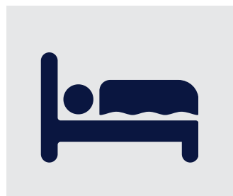
Πανδοχεία, Ενοικιαζόμενα Δωμάτια