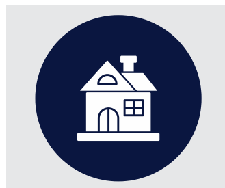
Ξενοδοχεία κάθε δυναμικότητας & Σαλέ