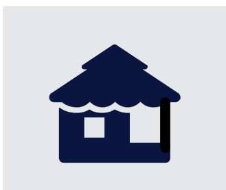
Ξενοδοχειακά Συγκροτήματα & Θέρετρα