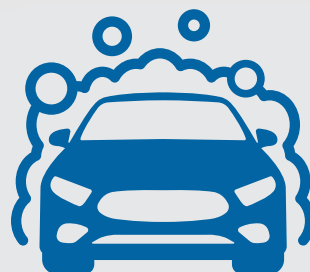
Πρόσθετες Υπηρεσίες (π.χ. Πλυντήρια)